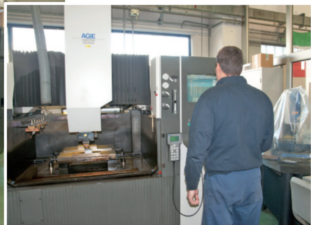
The mechanical tooling department is equipped with several machine tools: horizontal spindle grinding machines, NC milling machines, sinking and wire EDM machines, lathes and machining centres. Here are some of these machines at work.